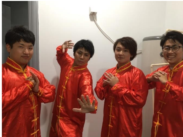
太極拳を体験する会津大学生