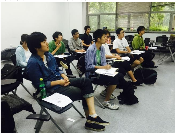
中国語クラス授業風景