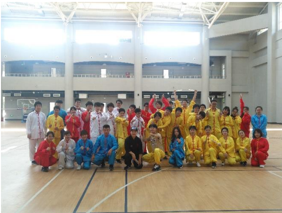
講座の一つで太極拳を体験