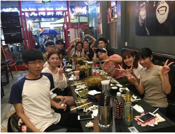
参加者との昼食会